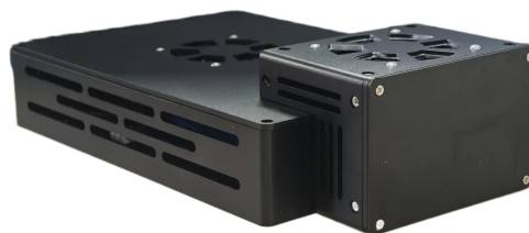
ASC-PIXAS 140K 探测器